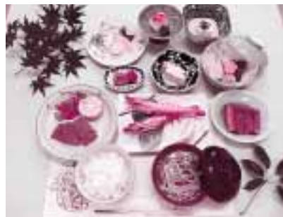
人間ドック利用者様用です