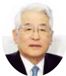
医療法人栄和会理事長